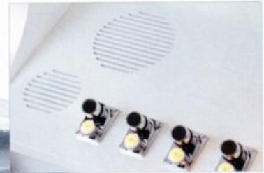
Die Abbildung zeigt die OAX1000 als Upgrade von einer LOUVRE. Aktuelle Bilder der PERGAMON OAX1000 lagen bei Redaktionsschluss noch nicht vor.