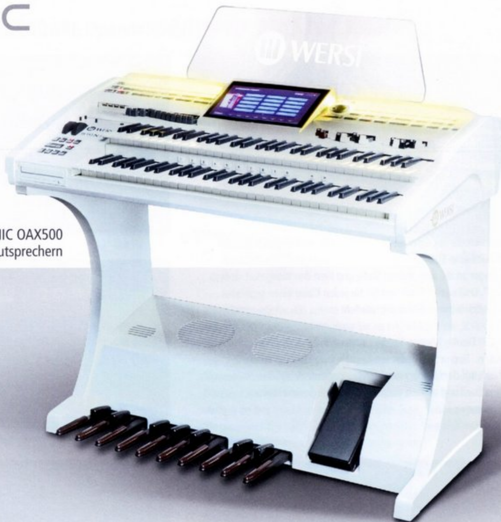
SONIC OAX500 mit integrierten Lautsprechern